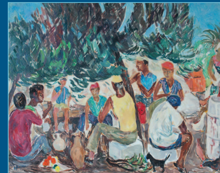
Operai seduti all'ombra, olio su tela, cm 65x80, 1971