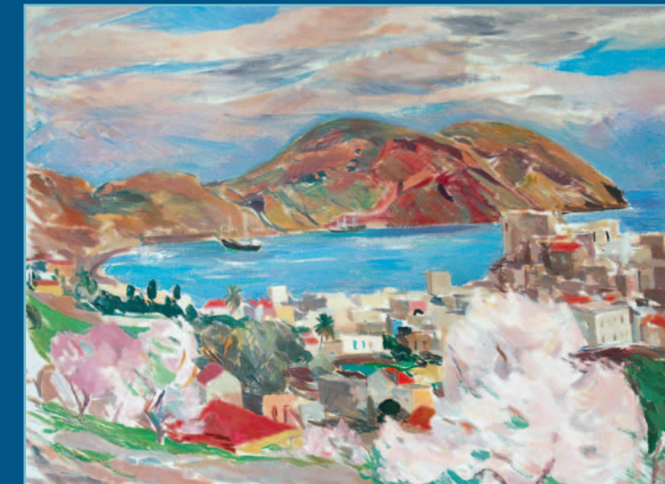
Veduta sulla città, olio su tela, cm 81x60, 1968