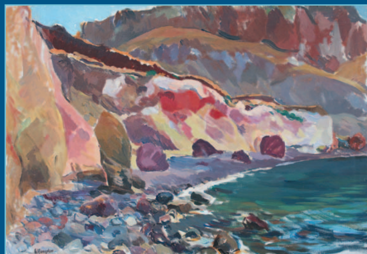
Valle Muria, olio su tela, cm 65x92, 1970