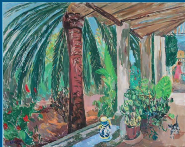
Veduta con terrazza, olio su tela, cm 80x79, 1979