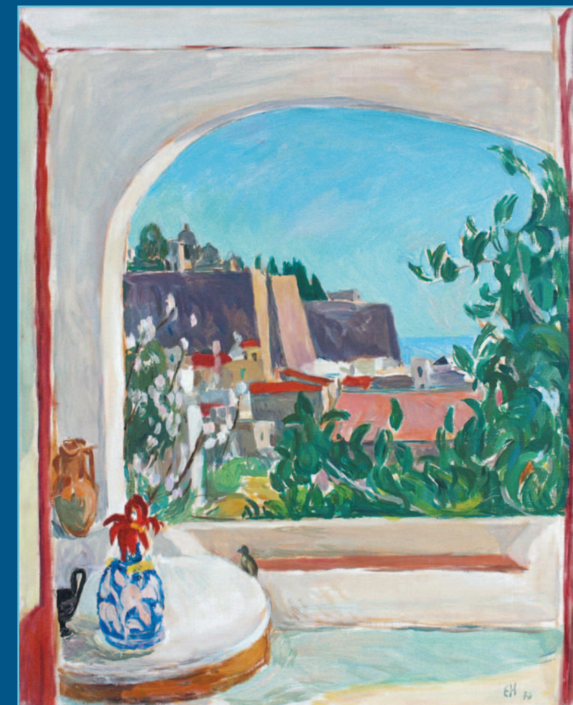
Veduta, olio su tela, cm 80x65, 1979

In copertina: Riva con grotta (Lazzaretto) , olio su tela, cm 64x80, 1960 Progetto grafico Laura Romano e Max Serradifalco - Stampa Officine Tipografiche Aiello & Provenzano, Bagheria (Palermo)