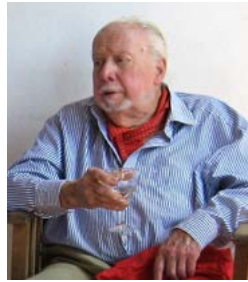
Sopra: Jeffrey Smart

Jeffrey Smart, uno dei più noti artisti australiani, è scomparso lo scorso giugno all'età di 91 anni nella sua casa in provincia di Arezzo . La passione per le arti figurative, in particolare per i paesaggi urbani, e l'amore per la cultura e per gli artisti italiani, lo hanno portato a trascorrere in Toscana gli ultimi 50 anni della sua vita. L'ex Primo Ministro australiano Julia Gillard ha detto che Smart ha garantito all'arte australiana un posto sulla mappa dell'era post-bellica e che le sue immagini di vita contemporanea sono state giustamente premiate come capolavori dell'arte moderna. L'Incaricato d'Affari Doug Trappett era presente al funerale a nome del Governo australiano.